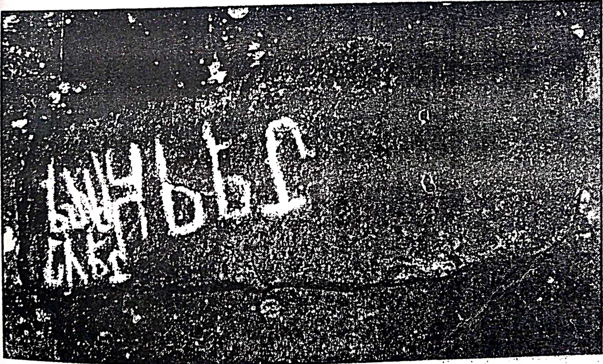
7.1 புலிமான் கோம்பை நடுகல் கல்வெட்டு