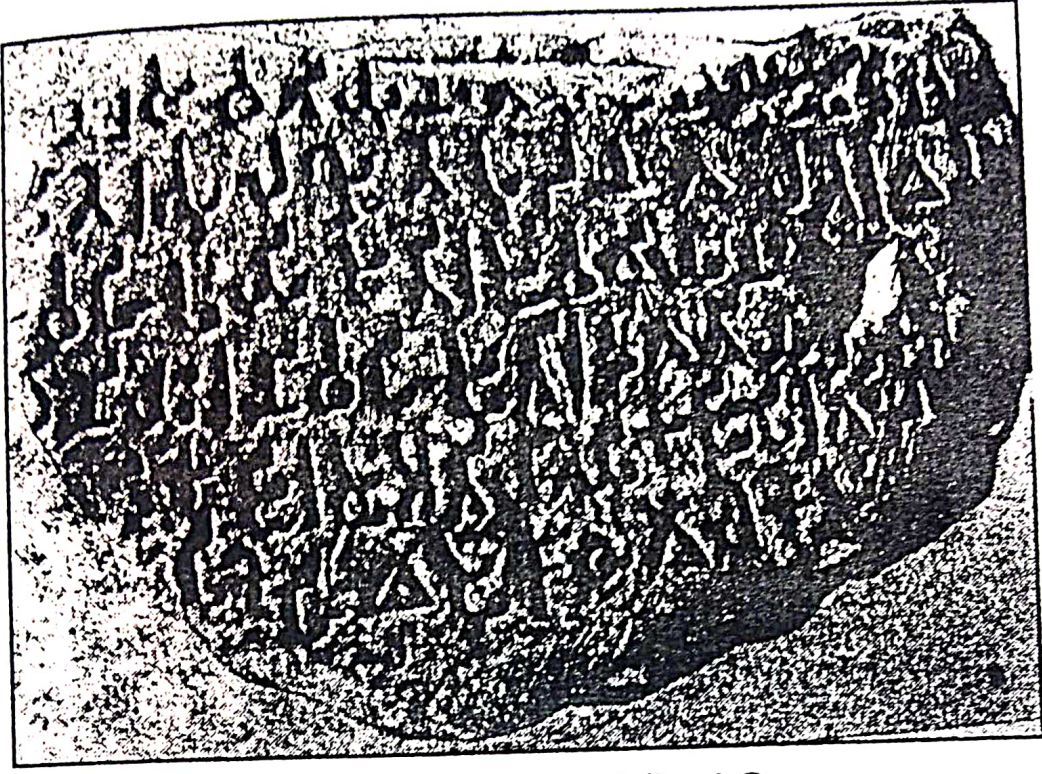
5.1 மகாஸ்தான் கல்வெட்டு

கல்வெட்டுக்களில் மன்னன் கொடையளித்த காலத்து அல்லது வெற்றி கொண்ட நிகழ்வினை குறிக்கின்றவகையில் நடைபெறுகின்ற விழா விற்போது அல்லது கோயில் கட்டுதல் போன்ற இறைபணிச் செயல்களை தெரிவிக்க வருகின்ற பொழுது அம்மன்னனின் புகழ் பாடுகின்றவையாகவே இருக்கின்றன. எடுத்துக்காட்டாக சமுத்திரகுப்தனின் வெற்றியைப் பறைசாற்றுவனவாக அவனது அலகாபாத் தூண் கல்வெட்டு அமைகிறது (பார்க்க படம் 2.5). இதே போன்ற தன்மையைக் கொண்டதுதான் யசோதர்மனின் மாண்ட்சோர் தூண் கல்வெட்டும் ஆகும். சாளுக்கிய மன்னன் இரண்டாம் புலிகேசியின் அய்யவொளெ கல்வெட்டு அம்மன்னன் சமணக் கோயில் எடுப்பித்ததை திறம்படக் கூறுகிறது. மேலைசத்ரப மன்னன் -ருத்ரதாமனின் ஜுனாகாட் கல்வெட்டும், கர்நாடக மாநிலத்தில் கிடைத்த சாந்திவர்மனின் தாளகுண்டா கல்வெட்டும் நீர்ப்பாசனப் பணிகள் மேற்கொண்டமையைத் தெரிவிக்கின்றன. மன்னனின் புகழ்பாடும் சிறப்பு வாய்ந்த கல்வெட்டுக்கள் பெரும்பாலும் அம் மன்னனின் அரசவைக் கவிகளால் தொகுக்கப்பட்டதாகக் காணப்படுகின்றன. எடுத்துக்காட்டாக சமுத்திரகுப்தனின் அரசவைக் கவியான ஹரிசேனன் இயற்றிய அலகாபாத் தூண் கல்வெட்டையும், இரண்டாம் புலிகேசியின் அரசவைக் கவியான ரவிகீர்த்தி இயற்றிய அய்யவொளெ கல்வெட்டையும் குறிப்பிடலாம் (பார்க்க படம் 2.6). துவக்க கால கல்வெட்டுக்கள் ஸ்வஸ்திபுரீ போன்ற ஓரிரு மங்கலச்சொல்லுடன் ஆரம்பிக்கும்.